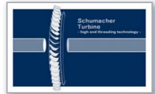
>> Schumacher Turbinen