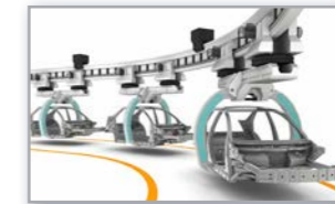
>> Automotive Industrie