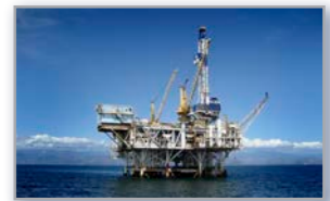
>> Öl & Gas Industrie